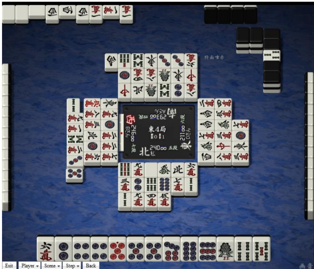
Рисунок 3 Завершение раздачи исчерпывающей ничьей при объявленном поне с игрока слева и двух понах с игрока напротив, три смещения, +1 +2 и +2 против часовой стрелки, последний сброс – игрока на позиции 3.

Игрок, объявляющий кан (не важно, открытый или закрытый) получает дополнительное взятие из стены, «забирая» его у игрока, которому на момент объявления кана принадлежало хайтей-взятие. Количество взятий из стены у этого игрока уменьшается, хайтей-взятие смещается «назад», по часовой стрелке. В случае объявления открытого кана к этому следует приплюсовать те же изменения, что и для открытого пона.